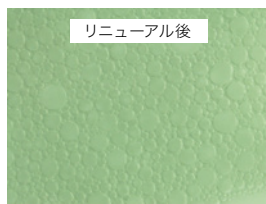
光学顕微鏡で20倍に拡大した泡の画像